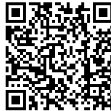
筆記選考会予約 (マイナビ)