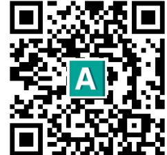
アートディンク 採用ページ