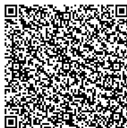
日本特殊陶業市民会館（グーグルマップ）